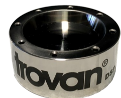
Dispensador de chips