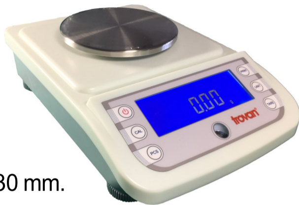
Plato: Ø 130 mm.