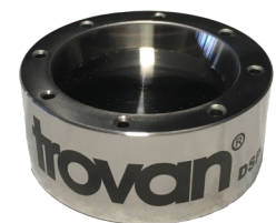
Dispensador de chips