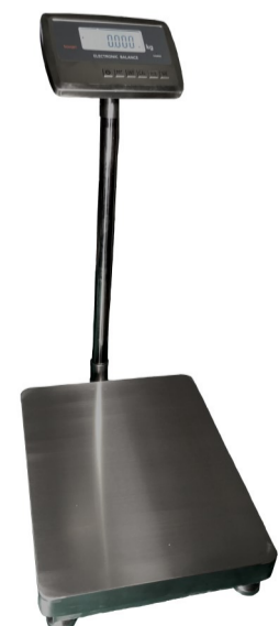
Balanza de pie