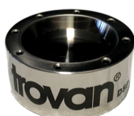
Dispensador de chips